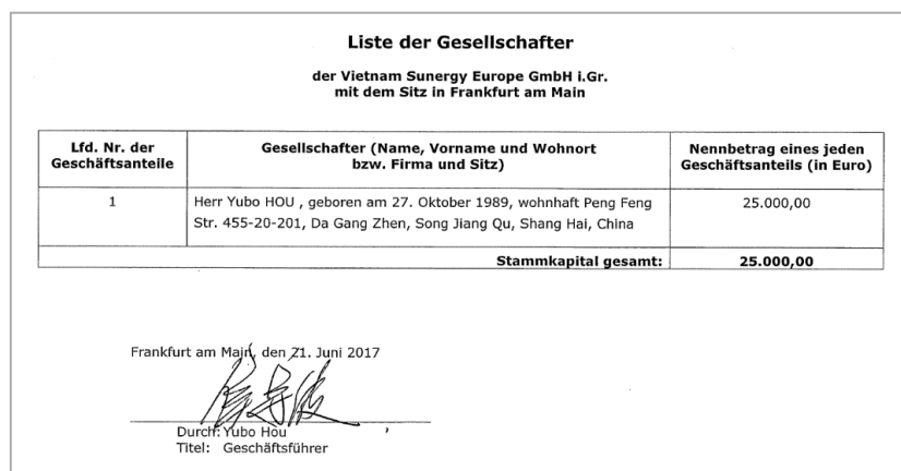
図XX - 2017年6月21日付け VSUN Europe 株主リスト