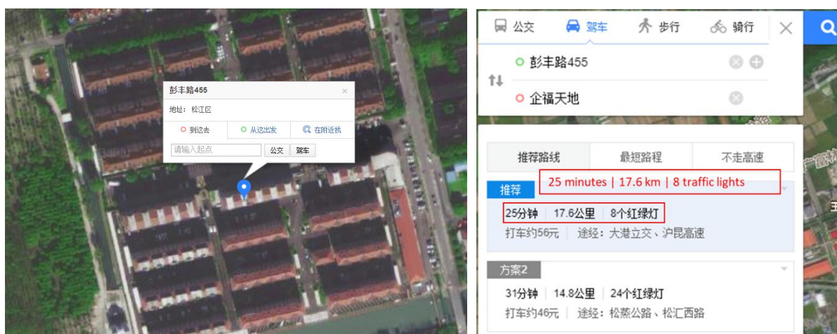
図XX・XX- 455 Pengfeng Road から 665 North Songwei Road へのルート